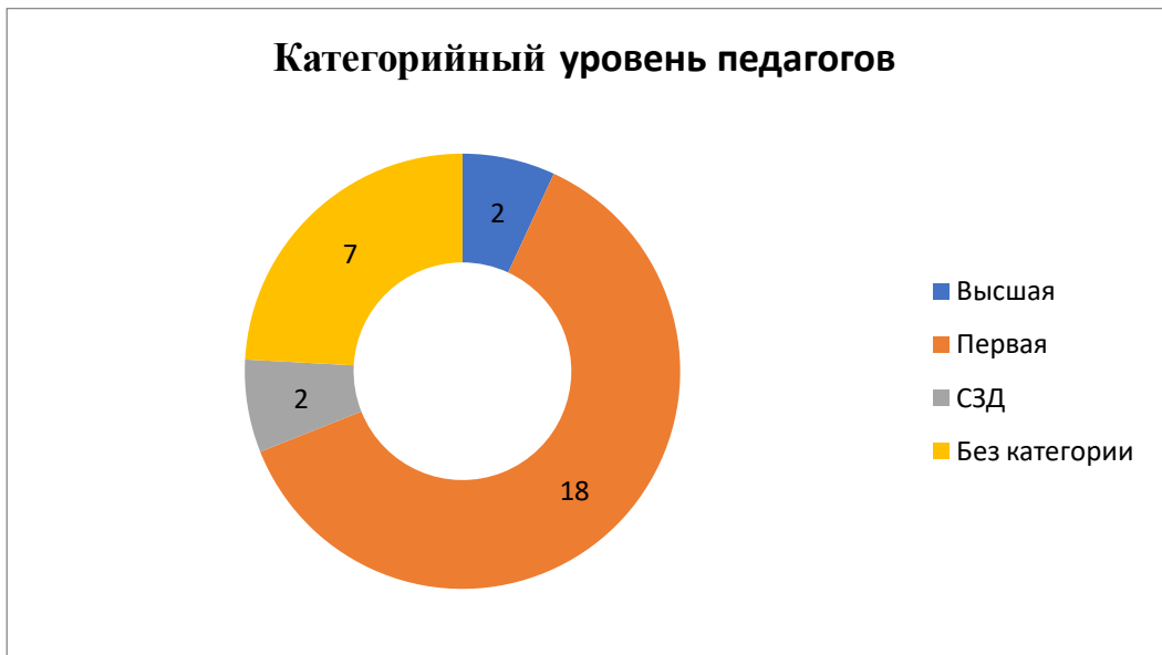
Диаграмма с характеристиками кадрового состава МАДОУ

обучается в Нижнекамском педагогическом колледже по специальности «Дошкольное воспитание».